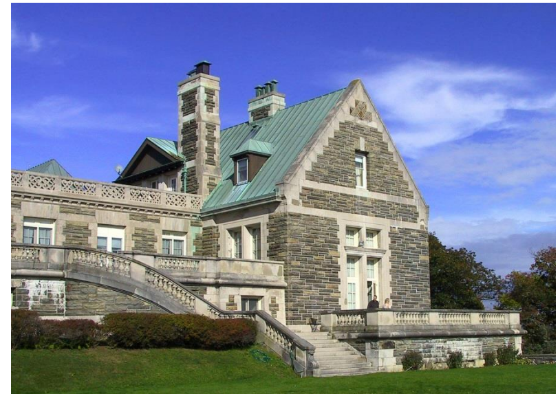
Arden Villa, Orange County, New York