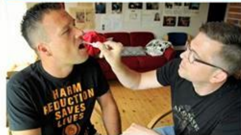
Foto: Anne Marie Rasmussen. Det er slik de vanligvis blir gjort. Her er det en av de som har fått vite om sin status. Foto: Anne Marie Rasmussen. Det er slik de vanligvis blir gjort. Her er det en av de som har fått vite om sin status.

JEKPAITTT C. Vi avdekket farlig virus med hurtigtest